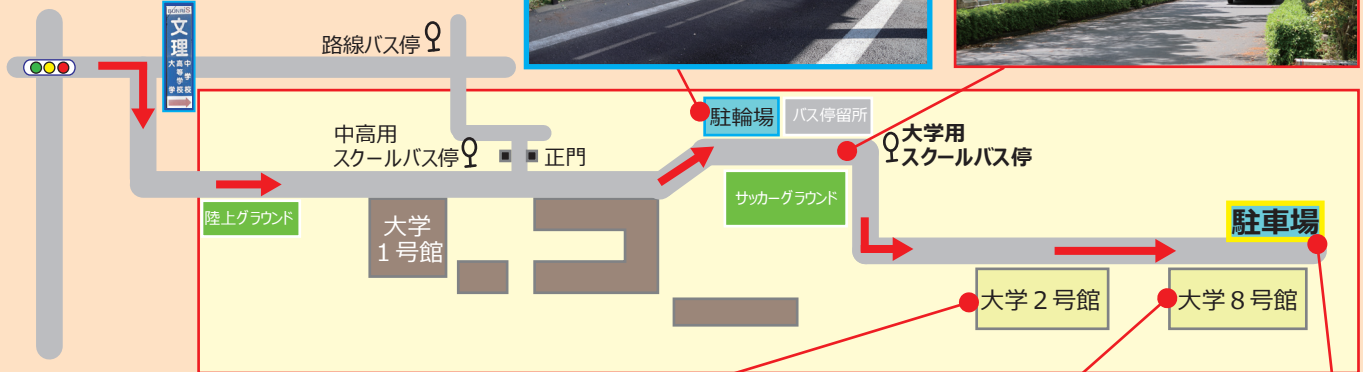
大学 2 号館

お車 をご利用の場合は、大学 8 号館横の「駐車場」をご利用ください。 付き添いの方は、試験会場には入ることができませんが、待機スペースを設けますので、そちらでお待ちいただけます。